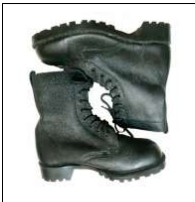
Sepatu PDL Hitam (Kualitas Terbaik)