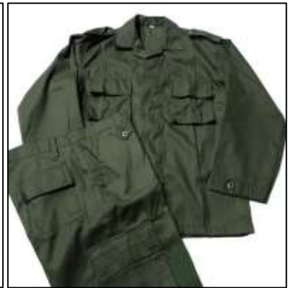
Baju PDL Hijau